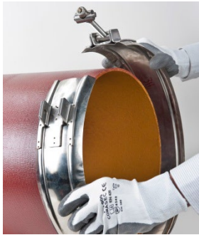
Schelle auf das Rohr- bzw. Formstückspitzende aufsetzen.