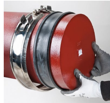
Formstück, Rohr oder Rohrende in die Manschette drücken.