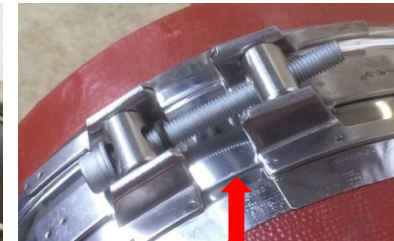
Je nach Größe des Verbinders ist entweder eine Blockmontage oder eine Montage mit Abstand möglich. Folgende Anzugsmomente sind zu beachten: