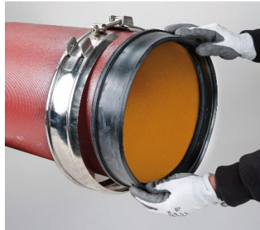
Dichtmanschette bis zum inneren, mittleren Anschlag auf das Rohrende aufsetzen.