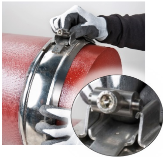
Die Schelle über die Dichtmanschette ziehen und die Schraube mit dem Gewindebolzen in die Lasche einlegen.