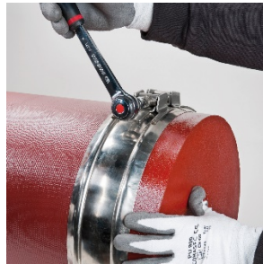
Die Schraube festziehen.