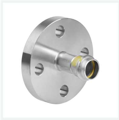
Sanpress Inox G-Flanschübergang mit SC-Contur Modell 0259 Artikel 735 784